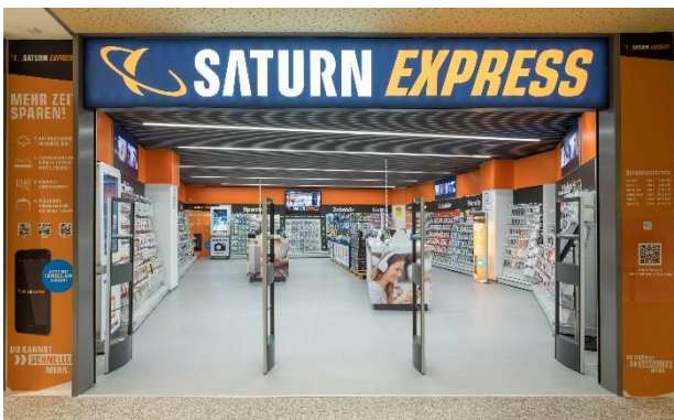
Saturn Express ist der erste kassa-freie Store in Europa und verbindet damit die Kernkompetenzen des Handels mit den Vorteilen des Online-Einkaufs.